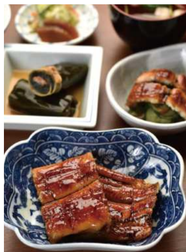
うなぎづくし定食

また、通販サイトでは蒲焼セットも販売。店で味わえるメニューと同じく、一つひとつ炭火で丁寧に手焼きした特大サイズの鰻がパッケージされている。保存料や添加物を一切使用していない、こだわりのタレと山椒煮がセットに。贈答用や来店が難しい方は、ぜひ利用してみてください。