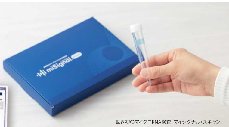
世界初のマイクロRNA検査「マイシグナル・スキャン」