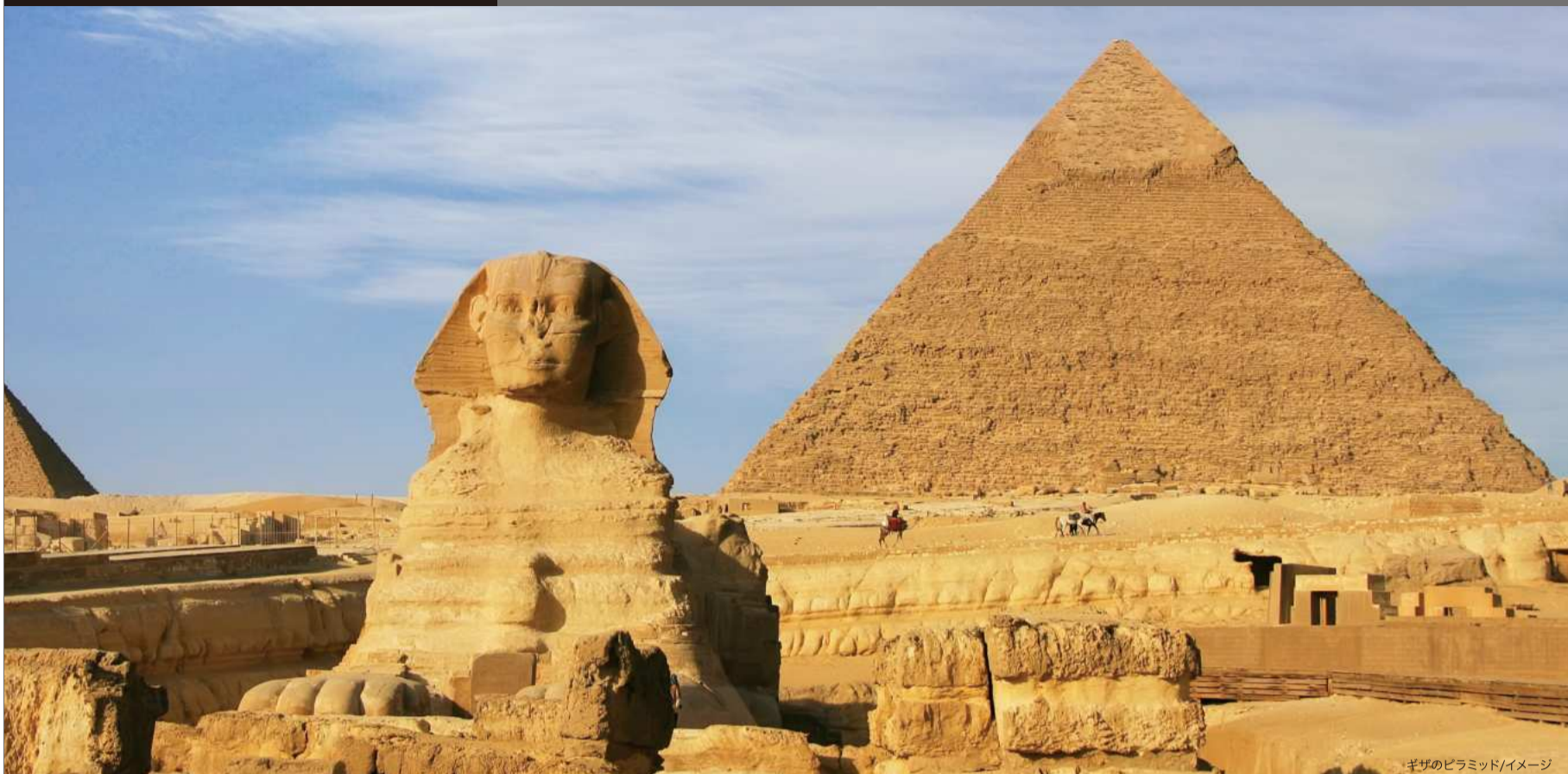
ギザのピラミッド/イメージ