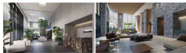
「プリリアタワー箕面船場 SKY & GARDEN」 エントランスホール完成予想CG