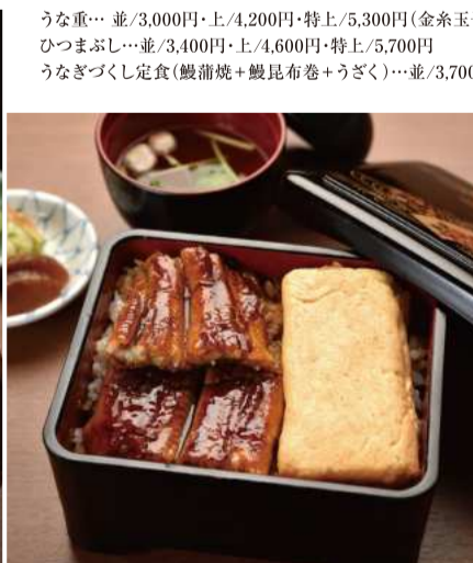
うなぎ重金糸玉子セット