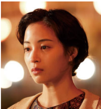
俳優 広瀬すずさん

1998年6月19日生まれ、静岡県出身。12年「Seventeen」の専属モデルとして芸能界デビュー。ドラマ『幽かな彼女』(13)で女優としての活動を開始。主な出演作に、『海街diary』(15)、『バケモノの子』(15)、『ちはやふる』シリーズ(16、18)、『四月は君の嘘』(16)、『怒り』(16)、『三度目の殺人』(17)、『打ち上げ花火、下から見るか？横から見るか？』(17)、『SUNNY 強い気持ち・強い愛』(18)、NHK連続テレビ小説『なつぞら』(19)、『ラストレター』(20)、『一度死んでみた』(20)、『いのちの停車場』(21)、『流浪の月』(22)、『映画 ネメシス 黄金螺旋の謎』(23)、『水は海に向かって流れる』(23)、『キリエのうた』(23)、Netflixシリーズ『阿修羅のごとく』(25)など。公開待機作に『片思い世界』(25年4月4日公開予定)、『遠い山なみの光』(25年夏公開予定)、『宝島』(25年9月19日公開予定)などがある。