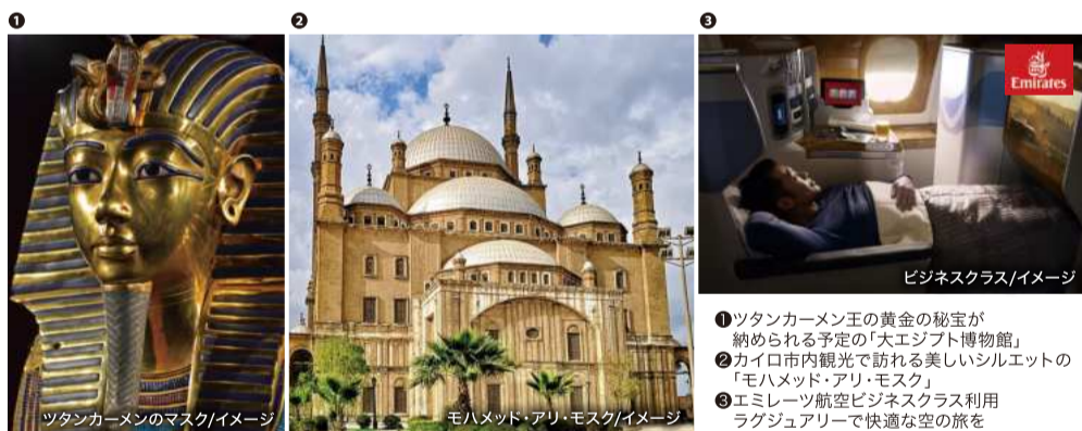
①ツタンカーメン王の黄金の秘宝が納められる予定の「大エジプト博物館」 ②カイロ市内観光で訪れる美しいシレットの「モハメッド・アリ・モスク」 ③エミレーツ航空ビジネスクラス利用ラグジュアリーで快適な空の旅