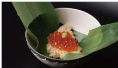
笹蒸しにしたシャリにいくらをのせた「いくら小鉢」