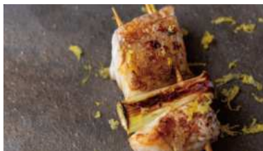
のどぐろの脂と白ネギの相性が絶妙な「のどぐろの串焼き」