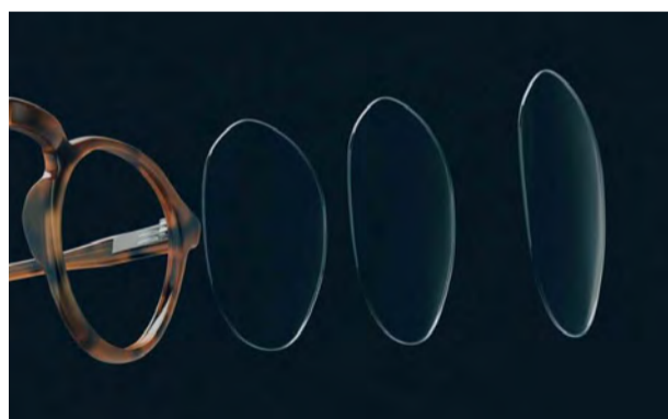
バリラックス XRシリーズ 99,000円(税込)～ ※レンズ参考価格、フレーム別

その革新的な機能性については、実際に体感しなければ分からない。XRシリーズの取扱店舗は左下のQRコードからアクセスできるので、ぜひ最寄りの店舗でより詳しい製品情報を。もしかししたら、のちに人生観が変わる出会いが待っているかも知れない。