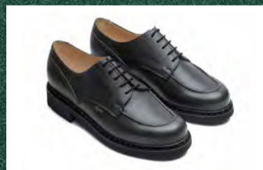
CHAMBORD / CERF KAKI 99,000円 (税込)