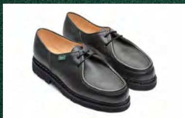
MICHAEL / CERF KAKI 99,000円 (税込)