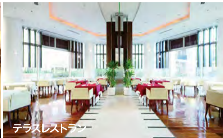
テラスレストラン