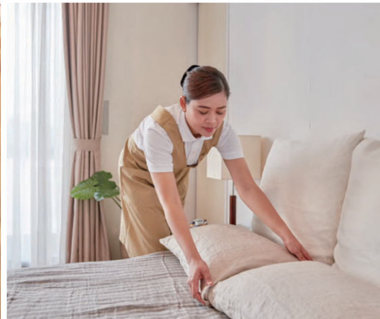
日本のハウスキーピングサービスと言えば、これまでは「水まわりに溜まった汚れを落とす」という発想が一般的だったが、「クラシニティ」はここからして異なる。1回あたり3.5時間が基準となるサービス時間をフルに使い、プロフェッショナルの技を駆使。玄関の水拭きから廊下の中木や窓枠まで、手に届くところのすべてを隅々まで綺麗にしてくれる。